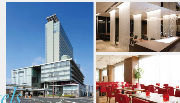
ANAクラウンプラザホテル

※宿泊先についてはお選びいただけません。ご了承ください。 ※5,000円(税込)追加していただくと、ANAクラウンプラザホテル岡山(夕食付)にご変更可能です。ご希望の際は、ドック申込み時(電話)に「ANAホテル希望」とお伝えください。