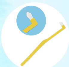
ワンタフトブラシ (1歯ブラシ)