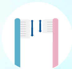
植毛部の大きさの違い